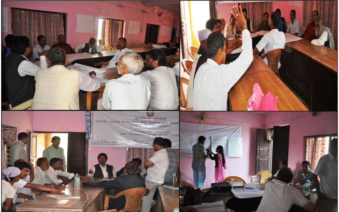
फोटो ३: नगरको विषयगत समस्याहरु सँग छलछल गर्दै सहभागीहरु

यसैगरी योजना तर्जुमाको लागि गठन भएका विषयगत समितिको नेतृत्वमा आफ्नो विषयसँग सम्बन्धित निकाय, स्थानीय विज्ञहरू र कार्यशालामा उपस्थिति सहभागीहरूलाई सात वटा सूहमा विभाजन गरी आफ्नो विषयसँग सम्बन्धित विषयगत समस्याहरू तथा मुद्दा सम्बन्धी गहन छलफल गरी यसको समाधानका लागि सम्भावित योजनाहरू पहिचान गर्दै सवै सहभागी उपस्थितिमा छलफल गर्दै अन्तिम योजना पहिचान गर्ने कार्य गरेका थिए ।