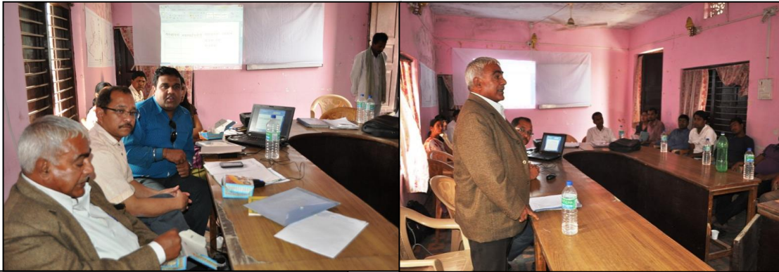
चित्र नं. २ कार्यपत्र प्रस्तुतिकरण गर्दै स्थानीय विज्ञहरू

यसरी परामर्शदाता मार्फत नगरका विभिन्न पक्षहरू, नगर विकासका अवसर तथा सम्भावनाहरूको वस्तुगत जानकारी गराइए पश्चात प्रथम नगर भेलामा पहिचान भएका यस नगरको आर्थिक विकासका सम्भावित अग्रणी क्षेत्रहरू कृषि तथा कृषि उद्योग, धार्मिक पर्यटन केन्द्र के कति कारणले अग्रणी क्षेत्र हुन सक्छन् भनी विज्ञहरूद्वारा कार्यपत्रहरूको प्रस्तुति गरिनुका साथै वृहद् छलफल गरिएका थियो।